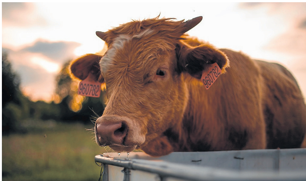
W woj. podlaskim jest ponad milion sztuk bydła

Najwięcej świń hoduje się w województwie wielkopolskim (ponad 4 mln sztuk), kujawsko-pomorskim (1,1 mln), łódzkim (1,2 mln), mazowieckim (prawie 1,3 mln sztuk). To dane z opracowania Głównego Urzędu Statystycznego „Zwierzęta gospodarskie w 2020 r.”