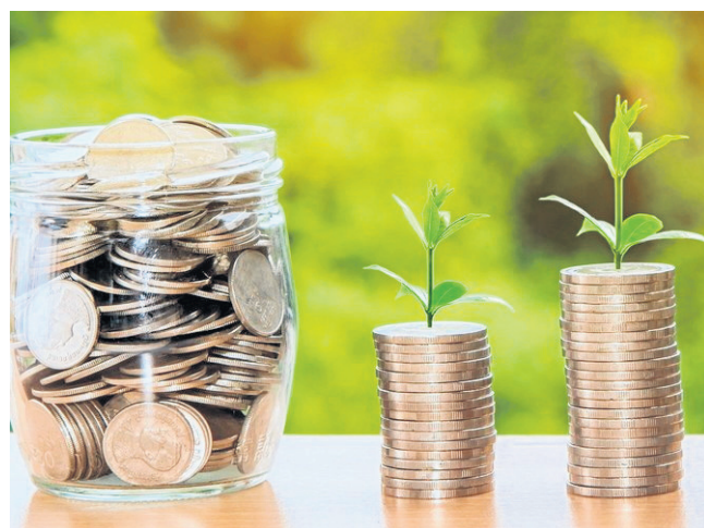
Od października rolnicy będą otrzymywać zaliczki dopłat 2021

W 2021 roku, podobnie jak w latach ubiegłych, ARiMR będzie mogła wypłacić rolnikom zaliczki na poczet płatności bezpośrednich. Resort rolnictwa przygotował rozporządzenia, dzięki którym od października na konta producentów rolnych będą mogły trafiać zaliczki dopłat 2021.