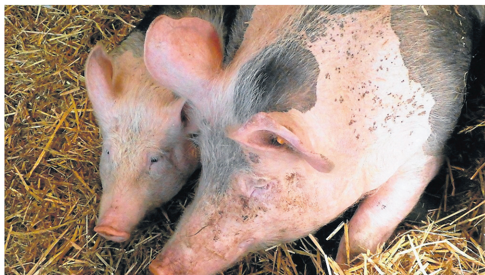
Zwierzęta hodowlane coraz częściej atakowane są przez różne bakterie

W ramach unijnej strategii „Od pola do stołu” zaplanowano ograniczenie sprze-