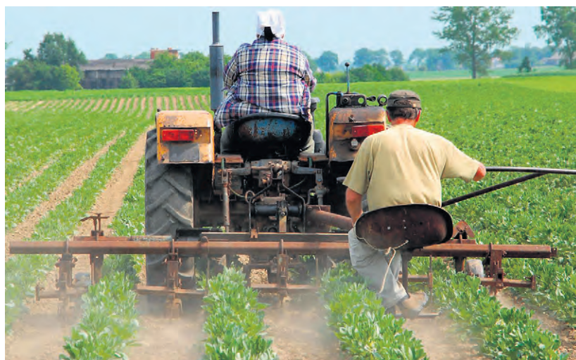
Umowę o pomocy przy zbiorach zawiera się na piśmie przed rozpoczęciem jej świadczenia

Jeśli nawet pomocnik ma już ubezpieczenie społeczne w KRUS lub ZUS, to nie zwalnia to rolnika z obowiązku zgłoszenia do ubezpieczeń w KRUS takiego pomocnika ani też z obowiązku opłacenia za niego składek zarówno na ubezpieczenie wypadkowe, chorobowe i macierzyńskie jak i na ubezpieczenie zdrowotne. ●