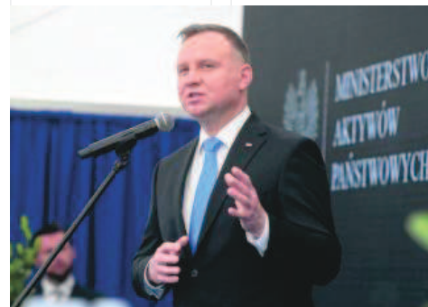
Ta inwestycja zmieni oblicze Polic na mapie przemysłowej naszego kraju - mówił Andrzej Duda, prezydent RP

Polipropylen jest jednym z podstawowych tworzyw. Ze względu na swoje właściwości (m.in. wytrzymałość temperaturą, chemiczną, niską gęstość, transparentność), jest powszechnie wykorzystywanym tworzywem w większości gałęzi gospodarki, w tym w sektorze opakowaniowym, tekstylnym, medycznym, motoryzacyjnym czy też budowlanym. ©