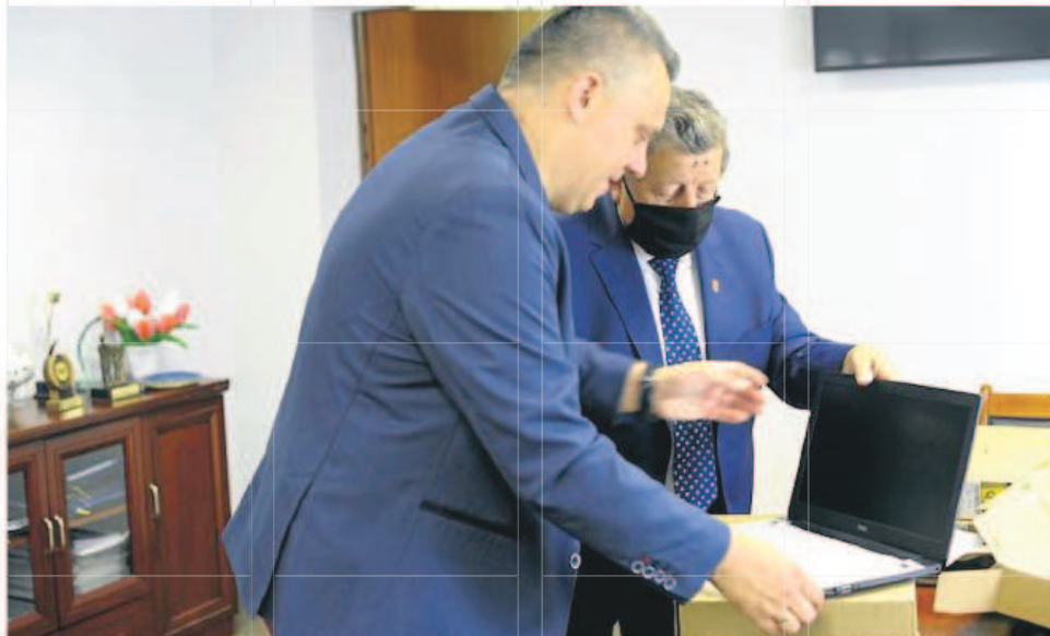
Wniosek „Zdalna szkoła” przeszedł pozytywnie ocenę i uzyskał dofinansowanie w wysokości 100.000 zł bezzwrotnej dotacji przeznaczonej na zakup laptopów dla szkół podstawowych, dla których organem prowadzącym jest Gmina Police.

„Zdalna Szkoła Plus” jest kontynuacją poprzedniego wsparcia szkół z terenu naszej gminy na sprzęt zakupiony w ramach kolejnej puli dotacji unijnych z programu Polska Cyfrowa na dofinansowanie zakupu sprzętu komputerowego umożliwiającego reali-