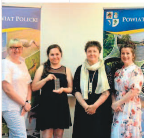
Tytuł „Zdrowego Samorządu” został przyznany za kampanię społeczną „Chore słowa i Ja” (Edycja 2017, 2018, 2019).

Kampania społeczna jest prowadzona przez Stowarzyszenie na rzecz Harmonii Społecznej w Policach. Jej celem jest uwrażliwienie społeczeństwa na temat wypowiedzianych słów w kierunku osób z zaburzeniami psychicznymi. Zachęcamy do obejrzenia spotów filmowych dotyczących projektu. Podczas śródojowej zdalnej gali przedstawiono wszystkich laureatów trzeciej już edycji Konkursu Zdrowy Samorząd, II Konkursu Start-Up-Med oraz