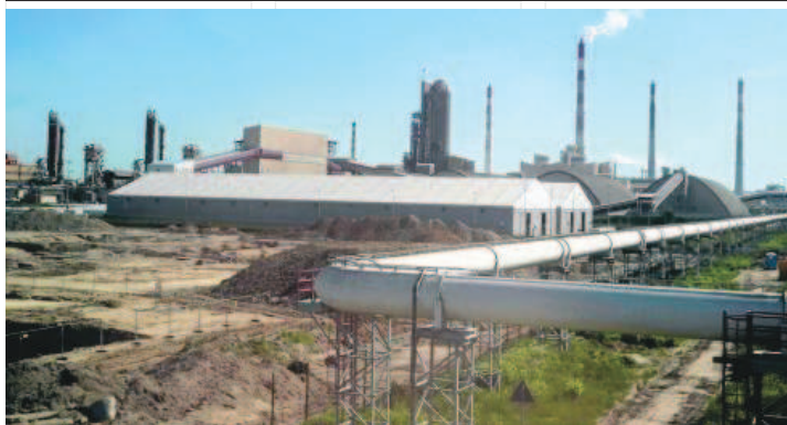
Produkcja polipropylenu w Policach ma w pełni zaspokoić potrzeby Polski na to tworzywo