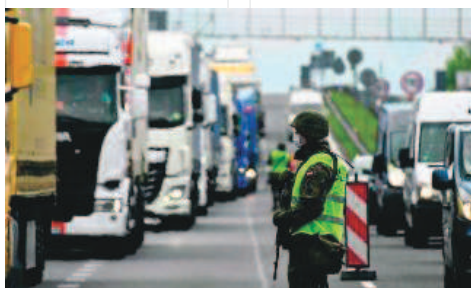
Ciężarną kobietę przetransportowano do najbliższego szpitala. Na szczęście pomoc przyszła w porę

Natychmiast udzielono pierwszej pomocy alarmującemu mężczyźnie, który w skutek silnego stresu zaczął omdlewać. W szybkim czasie niezwłocznie przystąpiono do kierowania ruchem tak by patrol