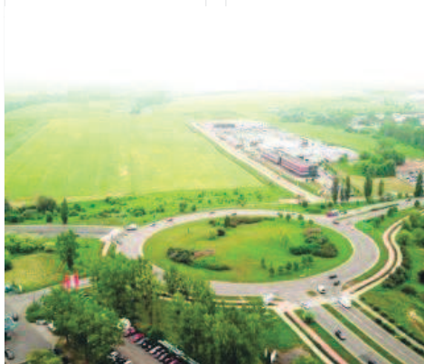
Rondo Hakena, stąd rozpocznie się nowa obwodnica