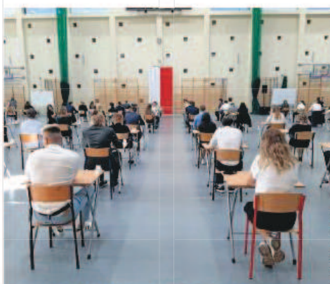
Do egzaminu dojrzałości przystąpiło 169 osób, w tym 128 to tegoroczni maturzyści