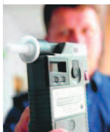
Bez prawa jazdy, ale po alkoholu. To wyczyn 53-latek

- Funkcjonariusze widząc zbliżający się z naprzeciwka pojazd, którym kierował znany im 53-letni mieszkaniec powiatu zajęli mu drogę i natychmiast rozpoczęli kontrolę, zwłaszcza, że za chwilę miała rozpocząć się procesja Bożego Ciała. Jak się okazało i tym razem policjanci mieli rację. Nie dość, że mężczyzna miał już wcześniej zatrzymane prawo jazdy za kierowanie pod wpływem alkoholu to tym