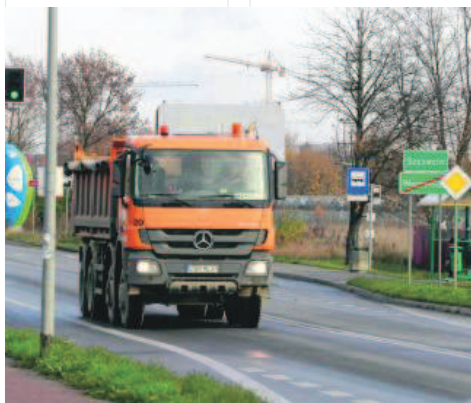
Mieszkańcom zależy na wyprowadzeniu ruchu tranzytowego

Dla pierwszego etapu nie będzie zmian w stosunku do opracowanej wcześniej dokumentacji. W tym przypadku zostanie ogłoszony przetarg od razu na roboty budowlane wraz