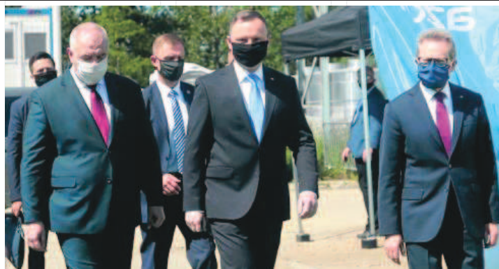
Goście spotkania nie bali się porównywać skali tego przedsięwzięcia do budowy portu w Gdyni