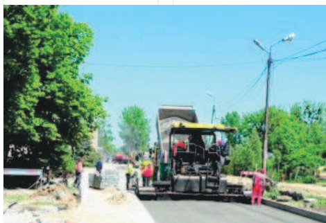
Droga przez szklarnie będzie miała ponad 1,1 km długości oraz 6 metrów szerokości

Dodajmy, że gmina Kołbaskowo otrzymała dofinansowanie z Funduszu Dróg Samorządowych w wysokości ok. 3,9 mln złotych. Prace mają potrwać do końca listopada 2020 roku. (JASZ)