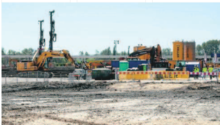
Generalnym wykonawcą fabryki jest Hyundai Engineering z wynagrodzeniem 992,8 mln euro