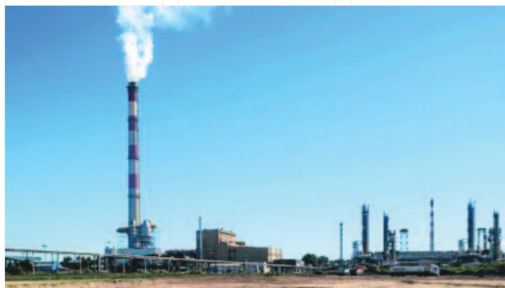
Rozruch zaplanowano na połowę 2022 roku, rozpoczęcie produkcji w drugiej połowie 2022 roku