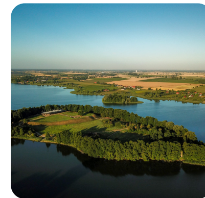
Ostrów Lednicki

Wyspa skarbów, chrzcielnica Polski. Przeprawa promem urozmaici wycieczkę pełną zadumy nad przeszłością. Na wyspie, po której stąpali Mieszko I i Bolesław Chrobry, zobaczymy relikty pałatium i kaplicy z basenami chrzcielnicami. Gospodarzem miejsca jest Muzeum Piastów na Lednicy.