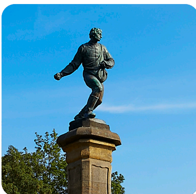
Pomnik Siewcy