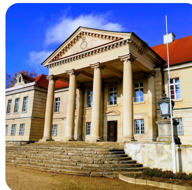
Portal pałacu w Czarniejewie

Okazate założenie pałacowo-parkowe nasuwa skojarzenia z najwspanialszymi siedzibami wielkopolskich rodów w Rydzynie i Rogalinie. Nic dziwnego, ich architekci projektowali także tutejszy kompleks. Dziś mieści on hotele i restaurację. We wnętrzach pałacu podejmowano znakomitych gości: to tutaj przybyli na obiad prezydenci sześciu państw podczas pielgrzymki Jana Pawła II w 1997 r.