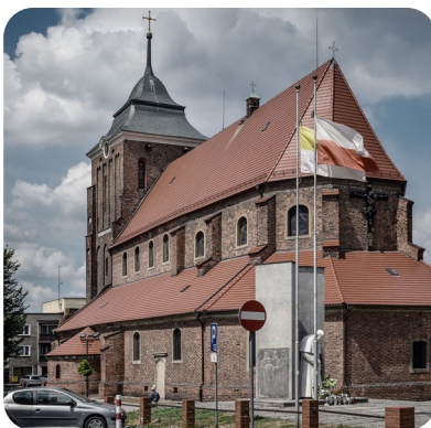
Września, fara