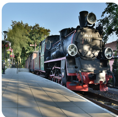
Makieta kolejki we Wrześni

Miasto rozstawił przed ponad stu laty strajk dzieci. O polskich uczniach protestujących przeciwko nauczaniu religii w języku niemieckim usłyszała wtedy cała Europa. Dziś wydarzenia te przypomina stała wystawa w Muzeum Regionalnym. Mieści się ono w budynku szkoły, w której odbywał się strajk.