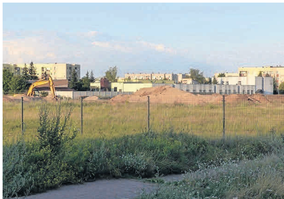
W Suwałkach najwięcej inwestycji związanych jest z wielorodzinnym budownictwem mieszkaniowym