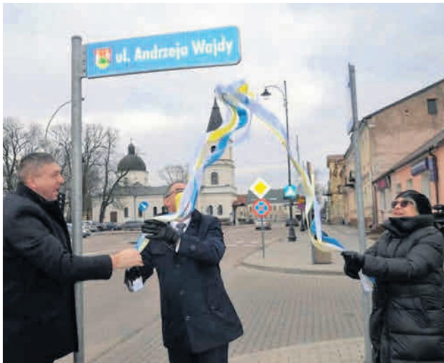
Od kilku lat władze miasta więcej pieniędzy inwestują w remonty małych, ale też ważnych ulic

Kończą się także prace przy zagospodarowaniu bulwarów nad Czarną Hańczą i przy dobudowie nowego skrzydła do Szkoły Podstawowej nr 4. Wkrótce ma być zrealizowana małutka, ale potrzebna inwestycja nad rzeką. A chodzi o budowę nowych schodów umożliwiających przejście z Polnej na ulicę Noniewicza. Ale - niestety - nie wszystko idzie zgodnie z planem i nie wszyscy suwalczanie mają powody do radości. Np. mieszkańcy Paca nie mogą doczekać się przebudowy chodnika oraz dziurawej jak szwajcarski ser jezdni. Wiadomo, że w tym roku na pewno nie będzie pieniędzy na ten cel. Nie ma też nadziei na to, że asfaltową nawierzchnię cieszyć się będą mieszkańcy nowo powstającego osiedla w sąsiedztwie ogródków działkowych.