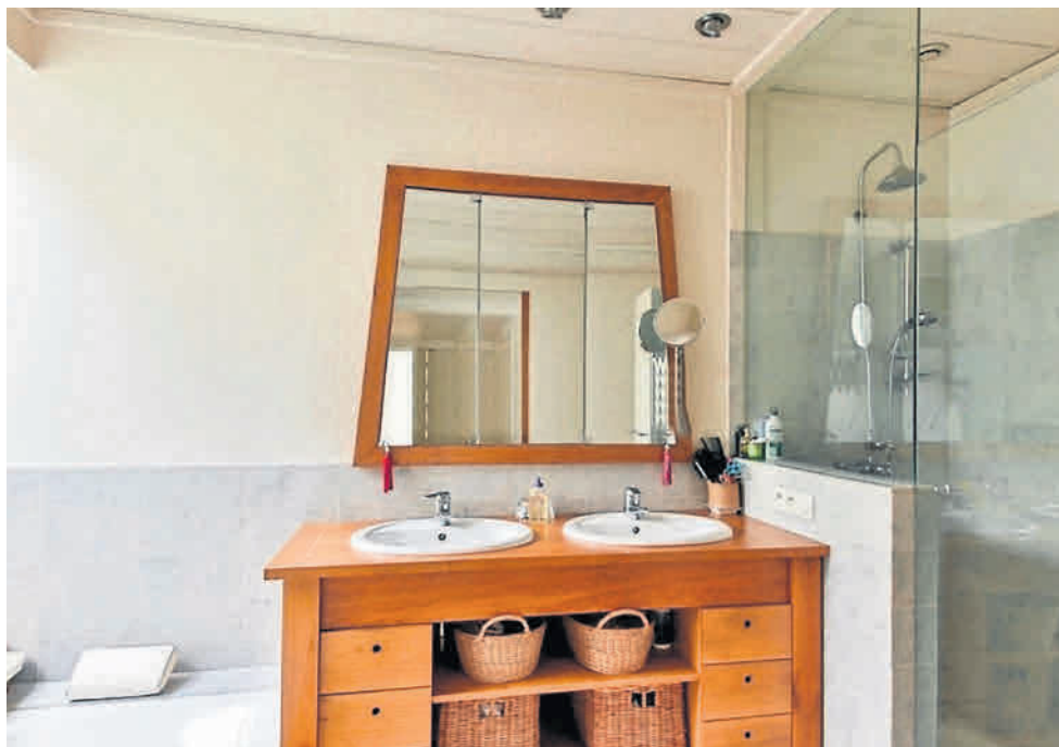
Meble z drewna egzotycznego to jedno z trwalszych rozwiązań, niestety, ale dość kosztownych

Zanim zdecydujemy się na zakup konkretnych mebli do łazienki, polecamy