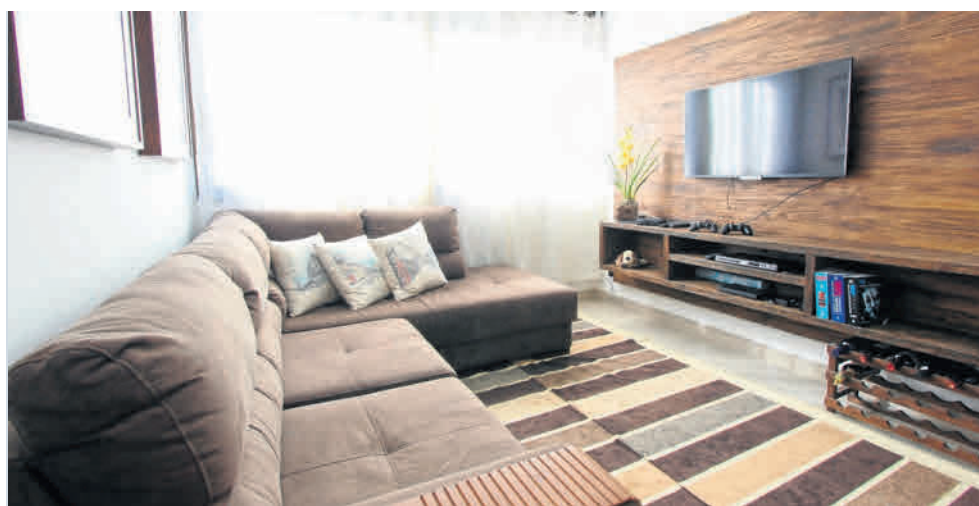
Na rynku dostępnych jest sporo różnorodnych rozwiązań, które pomogą nam uporać się z niesfornymi przewodami

Przemysłana koncepcja łączenia kabli nie sprawi oczywiście, że staną się one niewidoczne naszym mieszkaniu, ale z pewnością zaczniemy mieć wrażenie, że bardziej nad nimi zapanujemy. Z praktycznego punktu widzenia - łatwiejsze stanie się też bieżące odkurzanie przestrzeni wokół sprzętu komputerowego czy RTV.