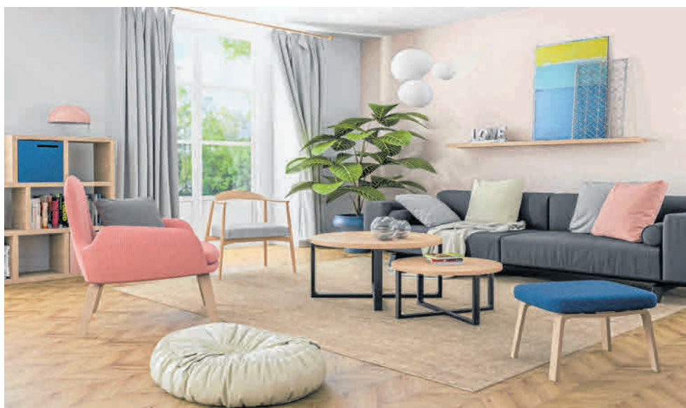
Różowe ściany i dodatki możemy wykorzystać w salonie, sypialni czy pokoju dziecięcym

Choć kolor różowy często kojarzony jest z kobiecością, intymnością i delikatnością, jego odbiór zależy od wybranego odcie-