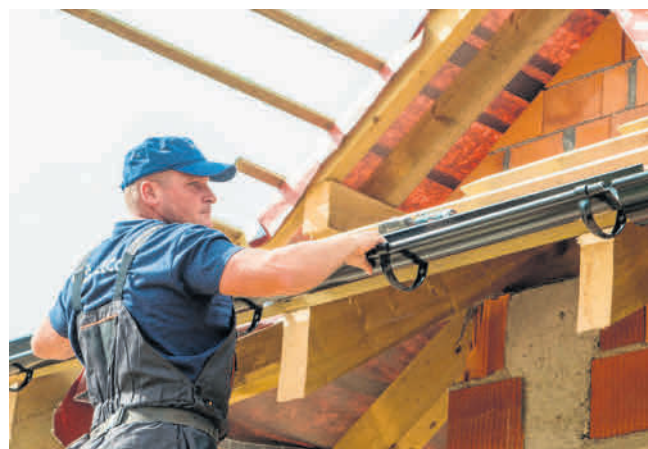
Właściwie skonstruowany dach i odpowiednio dobrany do niego system orynnowania są gwarancją ochrony domu przed szkodliwym działaniem czynników atmosferycznych

Najważniejszymi cechami dachu, które należy wziąć pod uwagę przy wyborze materiału pokryciowego dachu, jest jego kształt i kąt nachylenia. Wytyczne są regulowane miejscowym planem zagospodarowania przestrzennego, które określają, jakie warunki muszą spełniać budynki na danym terenie. Należy też pamiętać, że im mniej stromy jest dach, tym szerszym pokryciem powinien być wykonany.