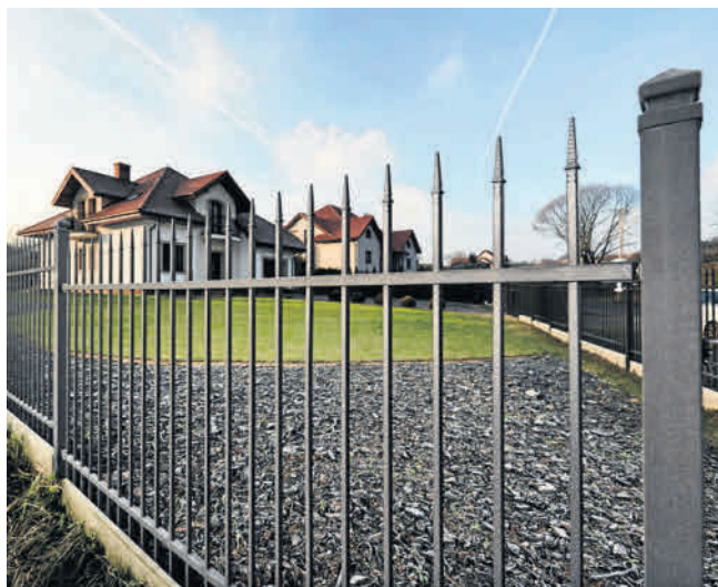
Ogrodzenie terenu posesji to z reguły pierwsza lub ostatnia inwestycja, na którą decydują się osoby budujące dom

● mur francuski (rzędowy) – kamień łupany lub ciosany (o kształcie przypominającym prostopadłościanny) układa się rzędami, aby kamienie układane na jednej wysokości miały zbliżony rozmiar, wysokość posz-