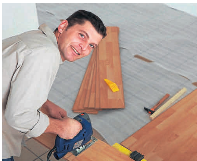
Producenci proponują różne sposoby montażu paneli podłogowych, ale łączy je to, że nie używa się do nich kleju

Po produktach kosztujących kilkanaście złotych za metr kwadratowy na ogół nie ma co oczekiwać trwałości i wytrzymałości. Panele o wyższych klasach ścieralności i wszechstronniejszym zastosowaniu to wydatek rzędu od 50 do ponad 100 zł/mkw. Przy takich cenach można już liczyć na uzyskanie podłogi nie tylko estetycznej,