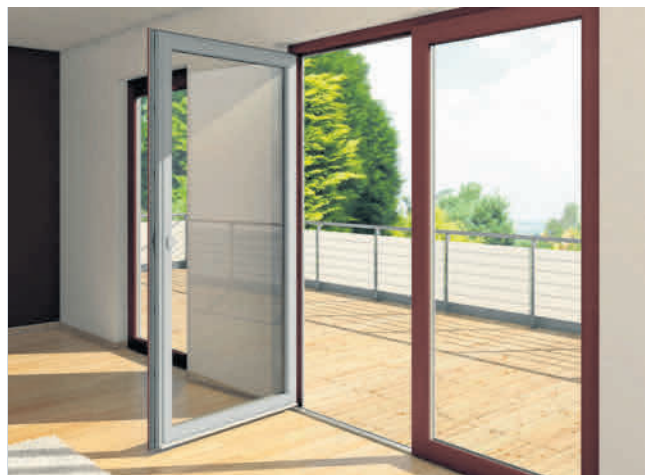
Wybór koloru stolarki to nie lada wyzwanie, dzięki któremu możemy stworzyć harmonijne fasady i aranżacje wnętrz

Obecnie, w dobie nowoczesnych technologii możliwy jest wybór stolarki okiennej o innym kolorze wewnątrz i na zewnątrz - czyli okien dwukolorowych, dostępnych np. w ofercie firmy Awilux.