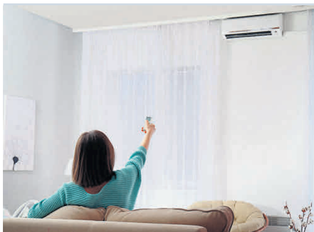
Klimatyzacja zwiększa komfort korzystania z mieszkania lub domu

Na etapie wyceny zapada decyzja o wyborze klimatyzatorów. Do wyboru mamy 3 rodzaje: splity, multisplity i rozbudowane systemy VRF.