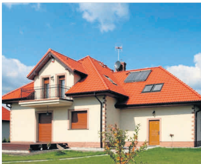
Projekt elewacji domu powinien pasować do stylu domu, otoczenia oraz koloru dachu

Drewno to materiał ponadczasowy - moda na niego wciąż wraca. Drewniana elewacja wygląda elegancko zarówno na zewnętrznej części bu-